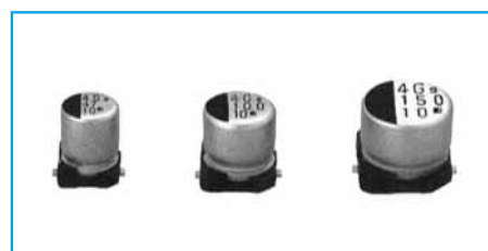
Marking color : Black print